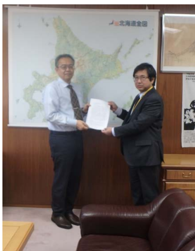
写真2 国土交通省北海道開発局 (水島局長)への提言